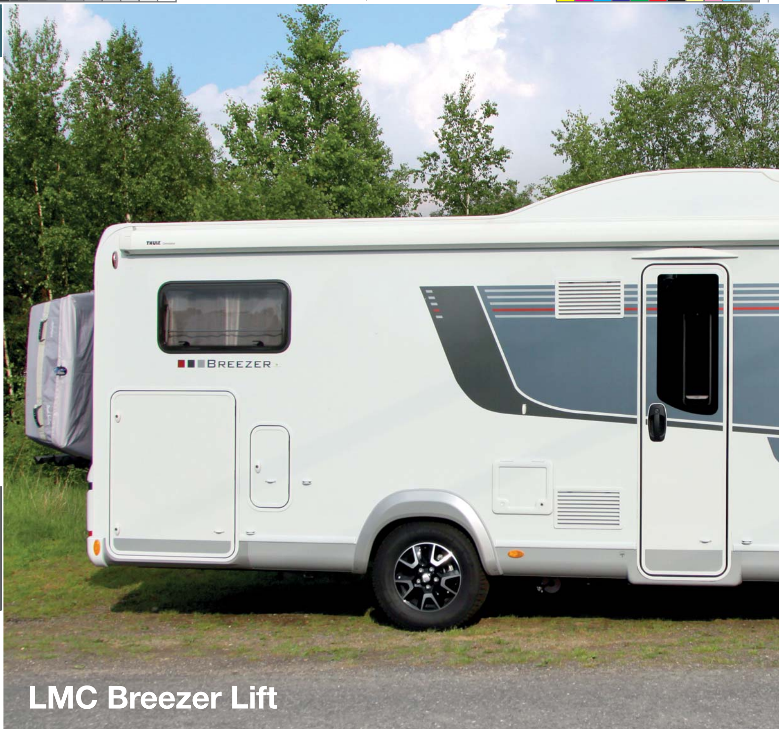
LMC Breezer Lift